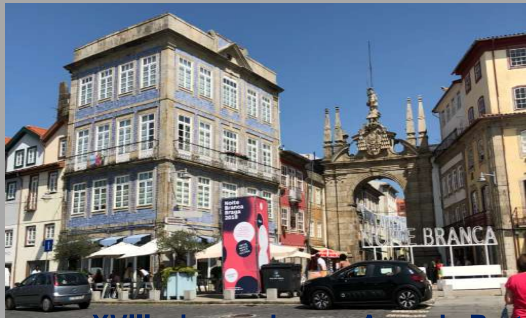
XVIII wieczna brama Arco da Porta