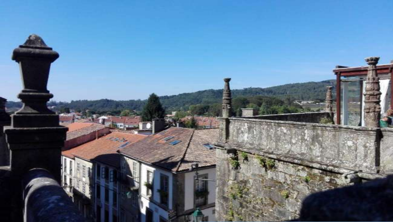
Santiago de Compostela, Hiszpania