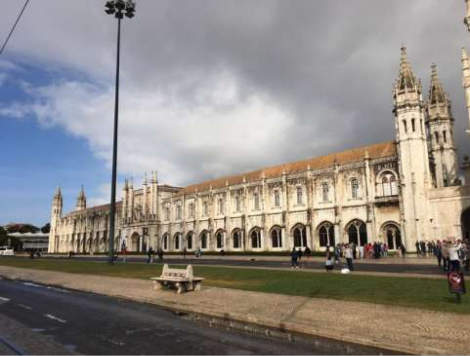
Torre de Belem