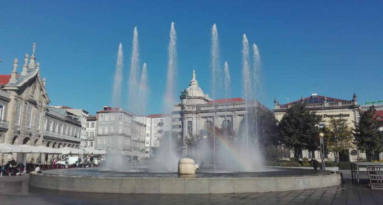
fontanna w centrum miasta