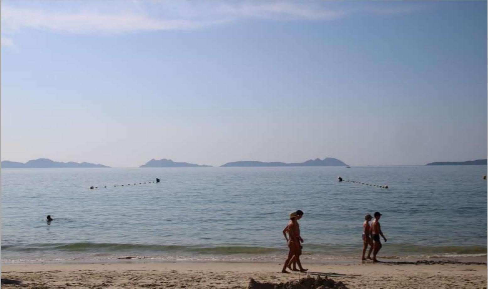
plaża w Vigo, Hiszpania

Najbardziej wyczekiwaną przez wszystkich wycieczką, była podróż nad ocean Atlantycki do miejscowości Vigo w Hiszpanii oraz Santiago de Compostela.