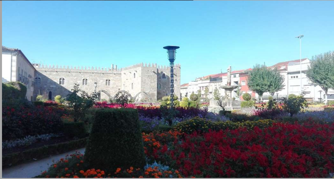
ogród Jardim de Santa Barbara