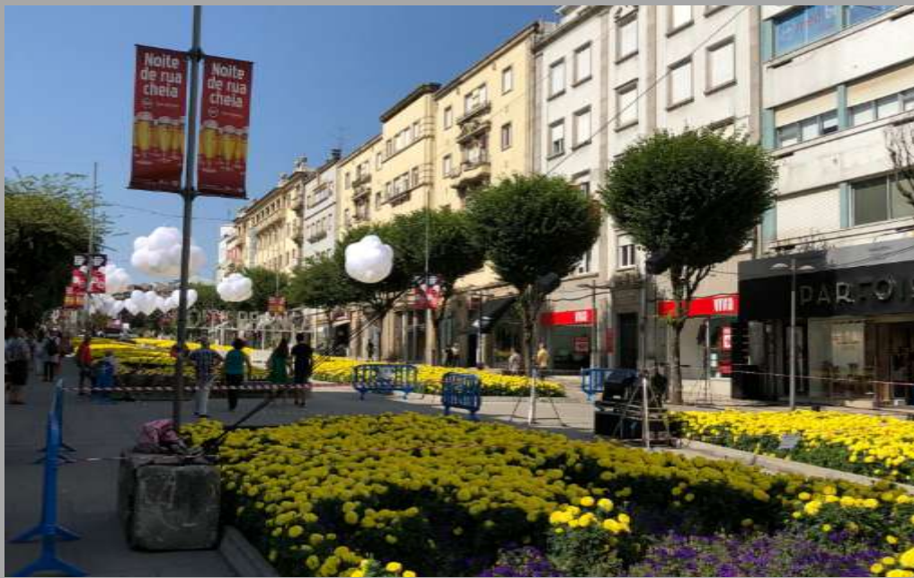
Główny deptak (Jardim da Avenida Central)